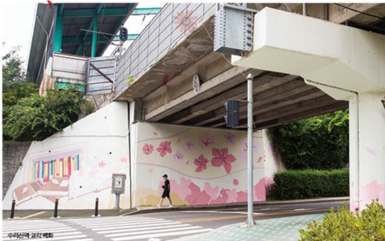
수리산역 교각 벽화