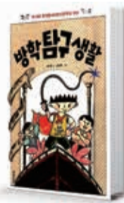
〈김선정〉 방학 탐구 생활