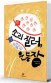
〈진형만〉 소리질러 운동장