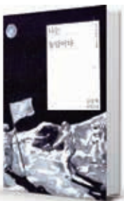
〈김중학〉 나는 농담이다