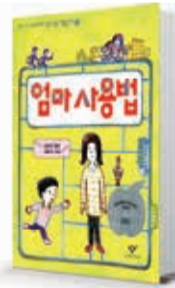
〈김성진〉 엄마 사용법