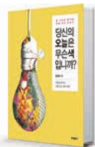
〈안진의의〉 당신의 오늘은 무슨색입니까