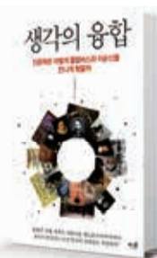
〈김경집〉 생각의 융합