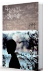
〈김연수〉 사월의 미, 칠월의 솔