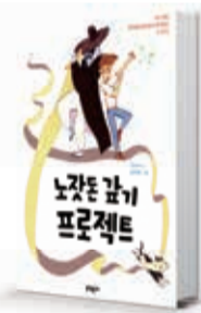
〈김진화〉 노잣돈 갚기 프로젝트