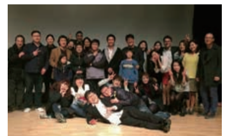
생활문화동호회 교류와 활성화를 위해 운영되고 있는 군포시의 생활문화동호회 네트워크 '군포생동감'(군포의 생활문화예술 동호회 함께 느껴요!)에 참여하고자 하는 동호회 및 시민은 군포문화재단(031-390-3071~3)에 문의하면 된다.