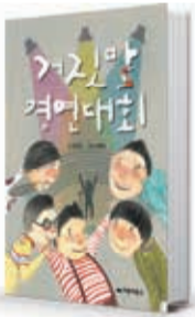
〈이지훈〉 거짓말 경연대회