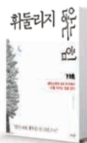
〈김무곤〉 휘둘리지 않는 힘